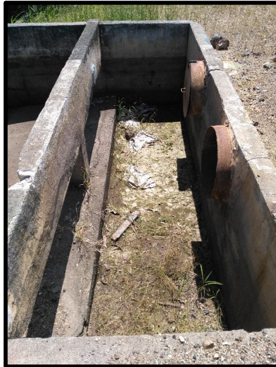
Figura 12. Décima segunda toma de agua encontrada en el sitio aprovechada por Azucarera el Viejo, está bajo concesión con el SENARA.

En el sitio existe un sistema de bombeo conformada por tres bombas para la extracción de agua y que al momento de la inspección no estaban extrayendo agua del río Tempisque tal y como se muestra en la Figura 12.