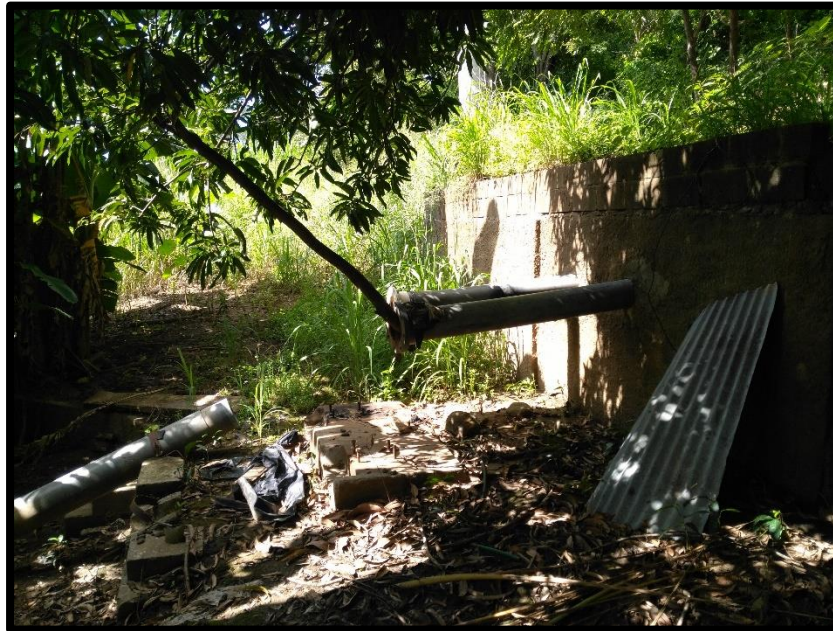
Figura 3. Tercera toma de agua encontrada en el sitio perteneciente al expediente 4858 a nombre de Granos del Pacifico S.A.

Según el Registro Nacional de Concesiones y Obras en Cauce de la Dirección de Agua; el expediente número 4858 a nombre de Granos del Pacifico actualmente se encuentra en estado Cancelado por Vencimiento (Prorroga) . No obstante, se recomienda continuar con el seguimiento y control a dicha toma de agua para verificar que efectivamente no se esté dando ningún aprovechamiento de agua en dicho punto hasta el tanto no cuente con su respectivo permiso otorgado por esta Dirección.