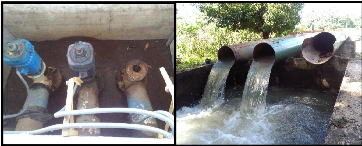
Figura 15. Décima cuarta toma de agua encontrada en el sitio perteneciente al expediente 12395 a nombre de Agrorice de Milano S.A. conocida como “Cerritos”

Además, en el momento de la inspección se encontraban bombeando agua del río Tempisque lo cual fue verificado por la funcionaria. En el sitio se pudo observar dos bombas de extracción de agua, tal y como se muestra en la Figura 15.