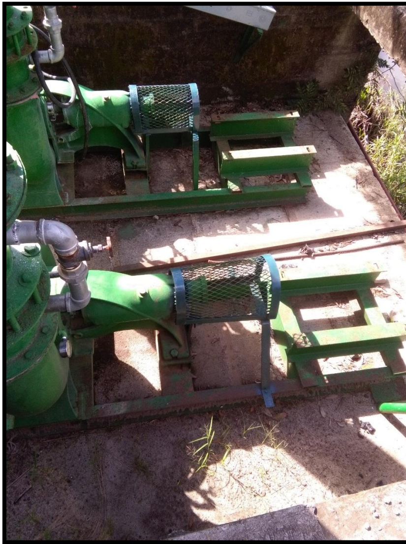
Figura 14. Décima Tercera toma de agua encontrada en el sitio perteneciente al expediente 4844 y 5165 a nombre de Central Azucarera Tempisque S.A. conocida como “Románticas”

Según el Registro Nacional de Concesiones y Obras en Cauce de la Dirección de Agua; el expediente número 4844 a nombre de Central Azucarera Tempisque S.A. actualmente se encuentra en estado Otorgado para un caudal de 140 litros por segundo para extraer agua entre los meses de junio a marzo, un caudal de 70 litros por segundo para el mes de abril y no pueden aprovechar el agua del río Tempisque para el mes de mayo; y que al momento de la inspección no estaban bombeando agua del río Tempisque.