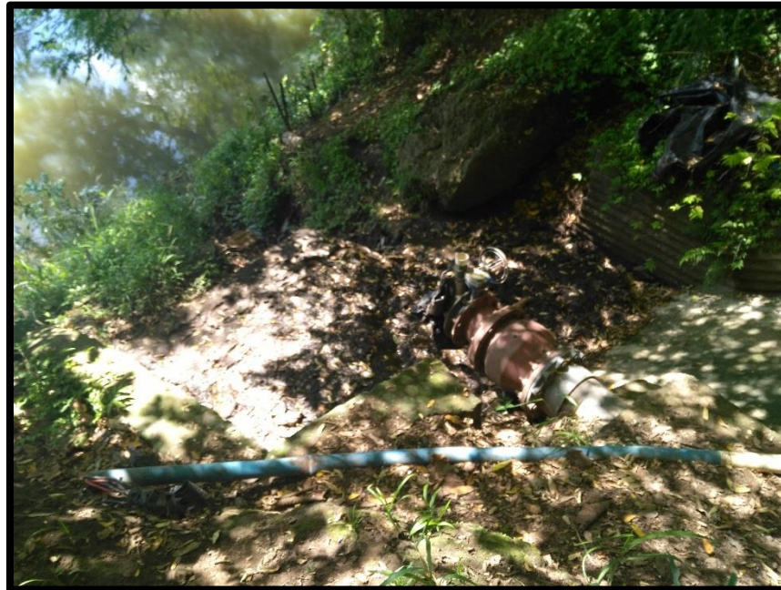
Figura 6. Sexta toma de encontrada en el sitio perteneciente al expediente administrativo número 1961 a nombre de Las Trancas S.A.

Según el Registro Nacional de Concesiones y Obras en Cauce de la Dirección de Agua; el expediente número administrativo 1961 actualmente se encuentra en Estado Otorgado para un caudal de 100 litros por segundo para extraer agua todo el año; y que al momento de la inspección no estaban aprovechando agua del Río Tempisque. Además se recomienda continuar con el seguimiento, control y además aforar dicha toma de agua cuando se esté aprovechando para asegurar la cantidad de agua extraída.