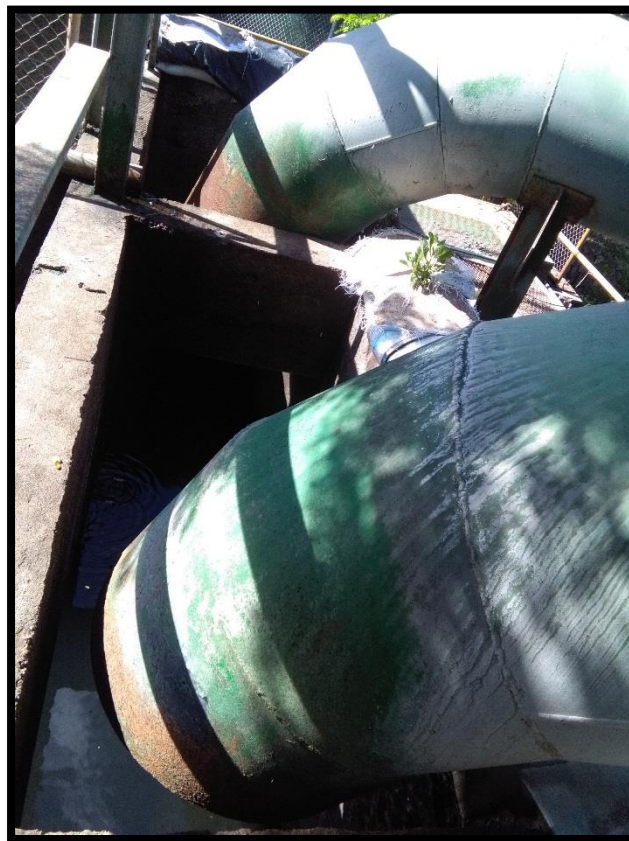
Figura 16. Décima quinta toma de agua encontrada en el sitio perteneciente al expediente 6472 a nombre de Central Azucarera Tempisque S.A.

Al momento de la inspección del sistema del bombeo de CATSA no estaban funcionando ninguna de las tres bombas que existen en el sitio lo cual fue verificado por la funcionaria, tal y como se muestra en la Figura 16.