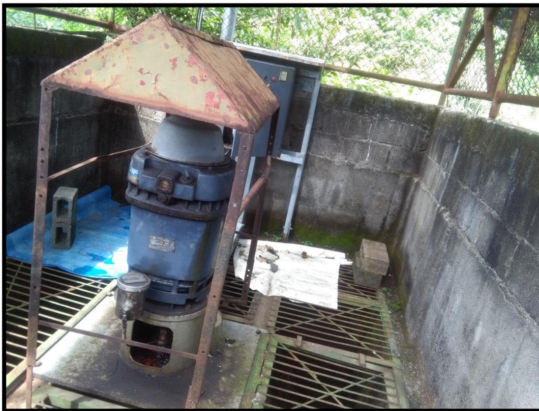
Figura 17. Décima sexta toma de agua encontrada en el sitio perteneciente al expediente 5558 a nombre de Hacienda Tempisque S.A. conocida como “Plazuela”

Además al momento de la inspección no estaban bombeando agua del río Tempisque lo cual fue verificado por la funcionaria. En el sitio se pudo observar una bomba de extracción de agua y la misma no estaba en funcionamiento, tal y como se muestra en la Figura 17.