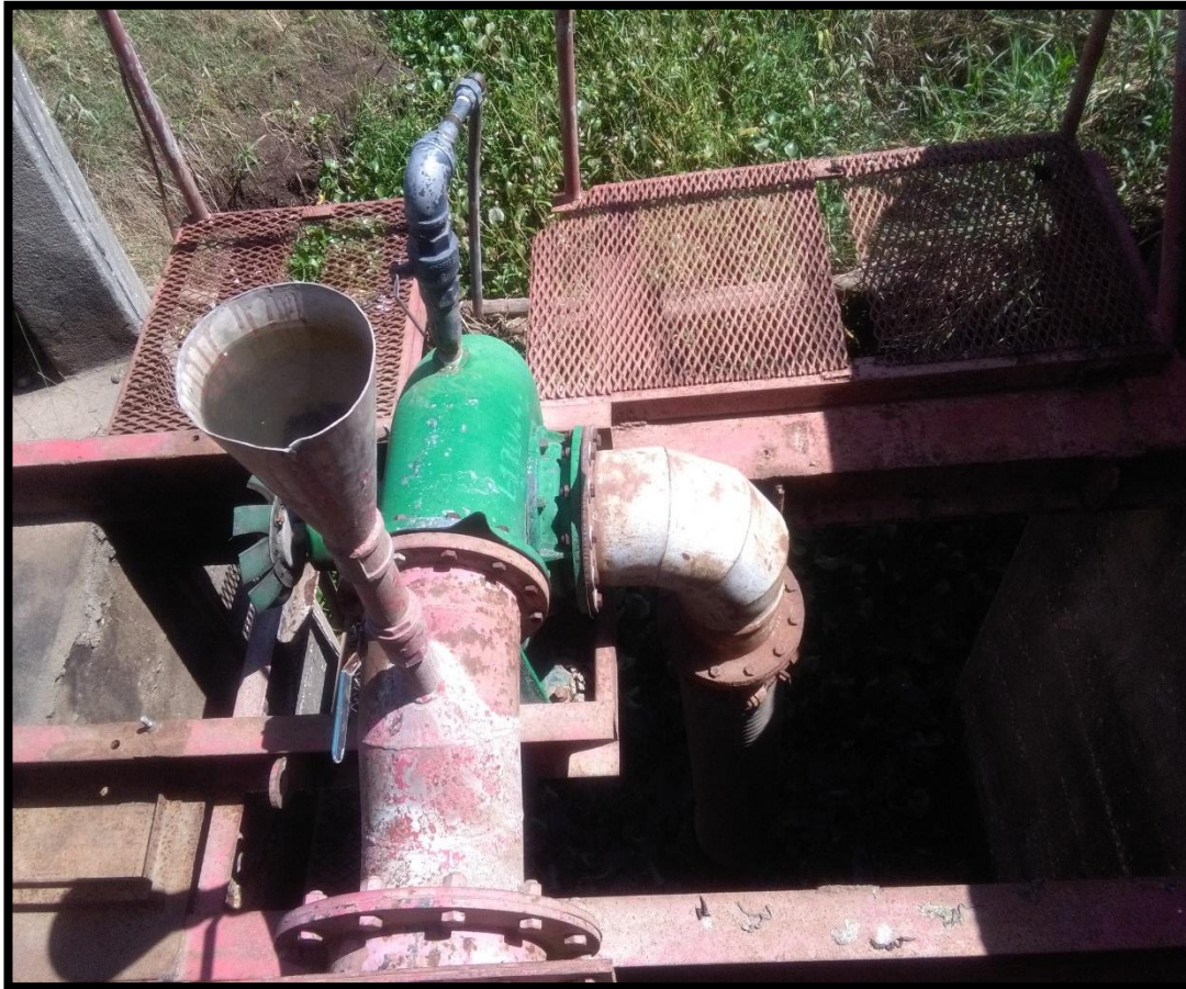
Figura 23. Vigésima segunda toma de agua encontrada en el sitio perteneciente al expediente 2316 a nombre de Central Azucarera Tempisque S.A. conocida como “Caimito”

Según el Registro Nacional de Concesiones y Obras en Cauce de la Dirección de Agua; el expediente número 2316 a nombre de Central Azucarera Tempisque S.A. actualmente se encuentra en estado Otorgado para un caudal de 400 litros por segundo para extraer agua entre los meses de diciembre a abril y no deben tomar agua entre los meses de mayo a noviembre. Y se aclara que no estaban extrayendo agua del río Tempisque al momento de la inspección.