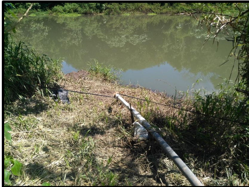
Figura 5. Quinta toma de agua encontrada en el sitio perteneciente al expediente administrativo número 10765 a nombre de Sociedad de Usuarios de Agua Auristela.

Revisado el Registro Nacional de Concesiones y Obras en Cauce de la Dirección de Agua; el expediente número administrativo 10765 actualmente se encuentra en Estado Cancelada por Vencimiento . Se recomienda seguir con el seguimiento y control a dicha toma de agua.