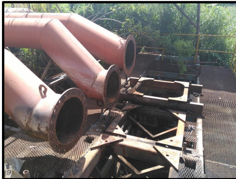
Figura 10. Décima toma de agua encontrada en el sitio perteneciente al expediente 1234 a nombre de Azucarera El Viejo S.A.

Según el Registro Nacional de Concesiones y Obras en Cauce de la Dirección de Agua; el expediente número 1234 a nombre de Azucarera El Viejo S.A actualmente se encuentra en estado Otorgado para un caudal de 568 litros por segundo para extraer agua entre los meses de diciembre a mayo, no pueden tomar agua entre los meses de junio a noviembre. Y se aclara que no estaban aprovechando agua del río Tempisque al momento de la inspección.