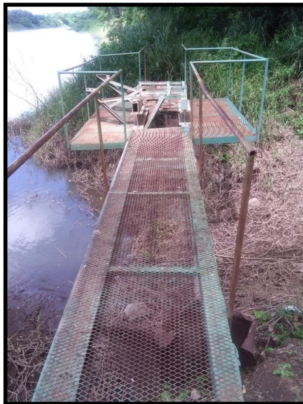
Figura 20. Décima novena toma de agua encontrada en el sitio perteneciente al expediente 5554 a nombre de Banco Crédito Agrícola de Cartago conocida como “Galanes”

En el sitio se verificó la existencia de una décima novena toma de agua sobre el río Tempisque conocida como “Galanes” ubicada en las coordenadas latitud 268.438 y longitud 369.067 que pertenece al expediente administrativo número 5554 a nombre de Banco Crédito Agrícola de Cartago. Además en el sitio se pudo constatar que no se encontraban las bombas, por lo que no estaban tomando agua del río Tempisque, lo cual fue verificado por la funcionaria al momento de la inspección, tal y como se muestra en la Figura 20.