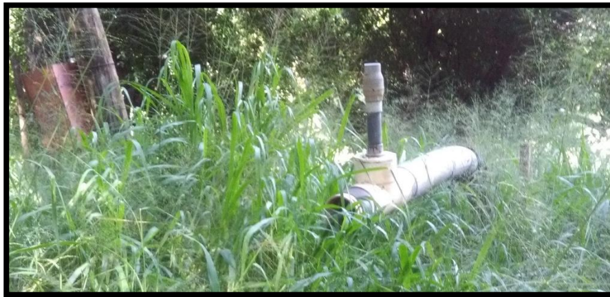
Figura 8. Octava toma de agua encontrada en el sitio perteneciente al expediente 11713 a nombre de Ganadera Limitada Monte Claro.

Según el Registro Nacional de Concesiones y Obras en Cauce de la Dirección de Agua; el expediente número 11713 a nombre de Ganadera Limitada Monte Claro, actualmente se encuentra en estado Cancelado Por Vencimiento . Y no estaban bombeando agua del Río Tempisque al momento de la inspección.