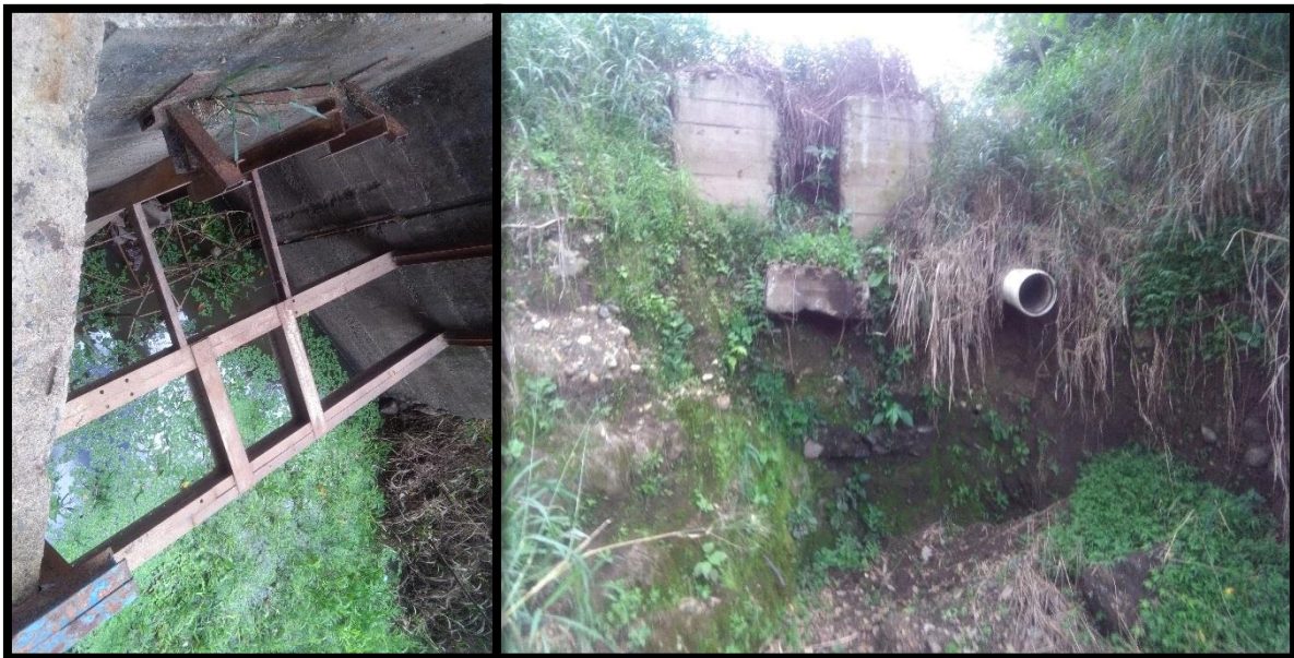
Figura 21. Vigésima toma de agua encontrada en el sitio perteneciente al expediente 6399 a nombre de El Rancho Gesling S.A. conocida como “Birmania”

En el sitio se verificó la existencia de una vigésima toma de agua conocida como “Birmania” esto a 40 metros aproximadamente aguas arriba de la toma conocida como “Galanes”. Dicha toma se ubica en las coordenadas latitud 268.430 y longitud 369.086 y la aprovecha Ingenio El Viejo dicha toma pertenece al expediente administrativo número 6399 que actualmente se encuentra a nombre de El Rancho Gesling S.A., tal y como se muestra en la Figura 21. Esta toma cuenta con una bomba, sin embargo, al momento de la inspección la misma no se encontraba en el sitio.