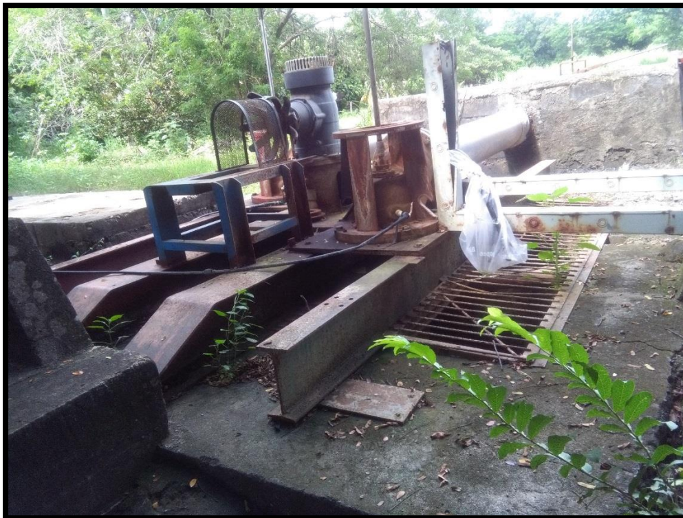
Figura 19. Décima octava toma de agua encontrada en el sitio perteneciente al expediente 4695 a nombre de Hacienda Tempisque S.A. conocida como “Isleta”

Además al momento de la inspección no estaban bombeando agua del río Tempisque lo cual fue verificado por la funcionaria. En el sitio se pudo observar que el sistema de bombeo se encontraba desinstalado, ya que las bombas se encuentran en mantenimiento, tal y como se muestra en la Figura 19.