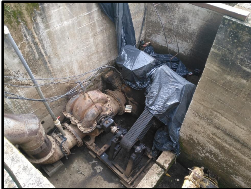
Figura 1. Primera toma de agua encontrada en el sitio perteneciente al expediente 13474 a nombre de Inmobiliaria Costa Alegre S.A.

río Tempisque, no obstante en el sitio cuentan con dos tuberías para conectarse con dos bombas; pero que al momento de la inspección no extraían agua, tal y como se muestra en la Figura 1.