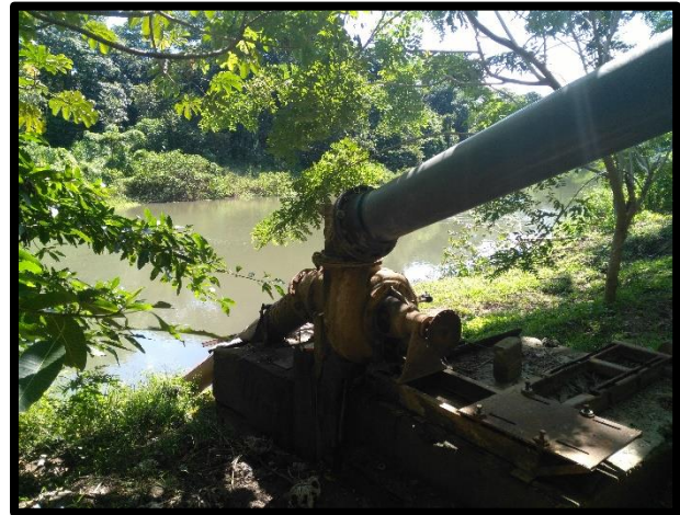
Figura 4. Cuarta toma de agua encontrada en el sitio perteneciente al expediente administrativo número 2095 a nombre de Inversiones Río Orinoco S.A.

Según el Registro Nacional de Concesiones y Obras en Cauce de la Dirección de Agua; el expediente administrativo número 2095 a nombre de Inversiones Río Orinoco S.A. actualmente se encuentra en estado Otorgado para un caudal de 225 litros por segundo para extraer agua todo el año. Se recomienda continuar con el seguimiento y control a dicha toma de agua.