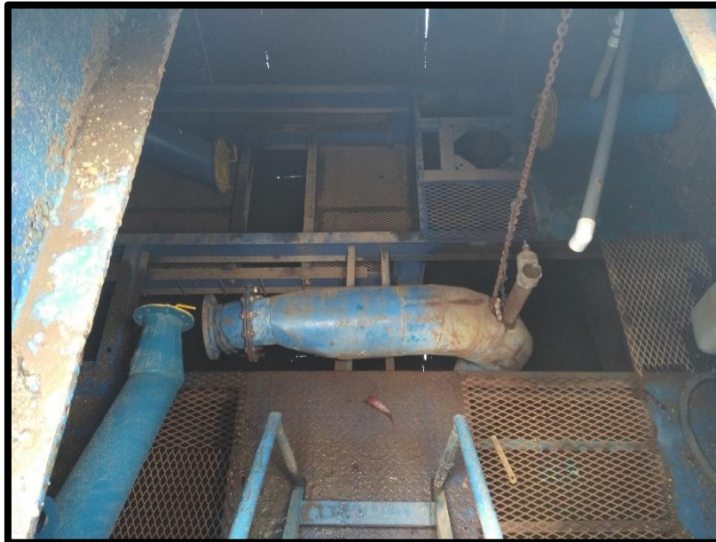
Figura 11. Décima primera toma de agua encontrada en el sitio perteneciente al expediente 2316 a nombre de Agrícola La Ceiba S.A. conocida como toma Lagarta.

En el sitio se verificó la existencia de una décima primera toma de agua sobre el río Tempisque ubicada en las coordenadas latitud 269.312 y longitud 375.094, dicha toma es conocida como “Lagarta” y pertenece al expediente administrativo número 1232 a nombre de Agrícola La Ceiba S.A. Al momento de la inspección el equipo de bombeo de dicha toma se encontraba en mantenimiento por lo que no se estaba extrayendo agua del río tal y como se muestra en la Figura 11.