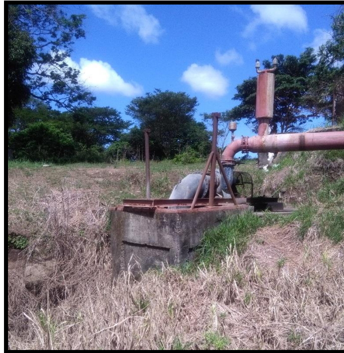
Figura 22. Vigésima primera toma de agua encontrada en el sitio perteneciente al expediente 2316 a nombre de Central Azucarera Tempisque S.A. conocida como “Guayabito”

En el sitio se verificó la existencia de una vigésima primera toma de agua sobre el río Tempisque ubicada en las coordenadas latitud 267.186 y longitud 372.572, dicha toma es conocida como “Guayabito” y pertenece al expediente administrativo número 2316 a nombre de Central Azucarera Tempisque S.A. Al momento de la inspección dicha toma no estaba extrayendo agua del río Tempisque, tal y como se muestra en la Figura 22.