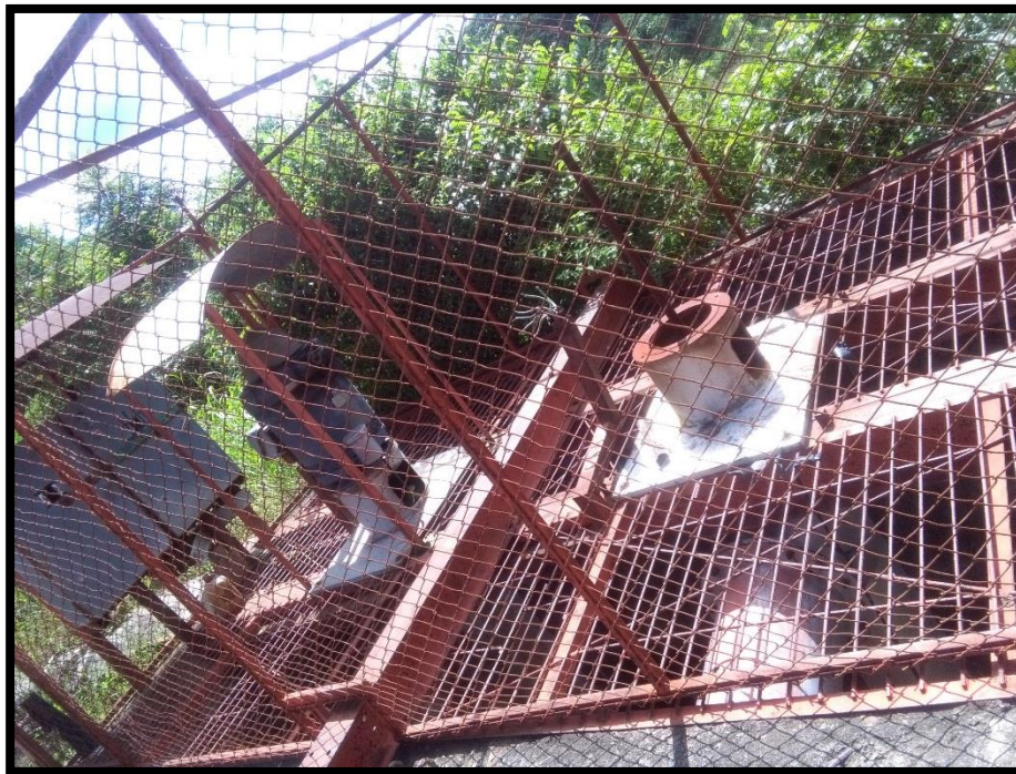
Figura 18. Décima séptima toma de agua encontrada en el sitio perteneciente al expediente 4695 a nombre de Hacienda Tempisque S.A. conocida como “Jocotes”

Además al momento de la inspección no estaban bombeando agua del río Tempisque lo cual fue verificado por la funcionaria. En el sitio se pudo observar un sistema de bombeo conformados por dos bombas de extracción de agua, y que al momento de la inspección solo se observó una bomba y la misma no estaba en funcionamiento, además la otra bomba no estaba ubicada en el sitio tal y como se muestra en la Figura 18.