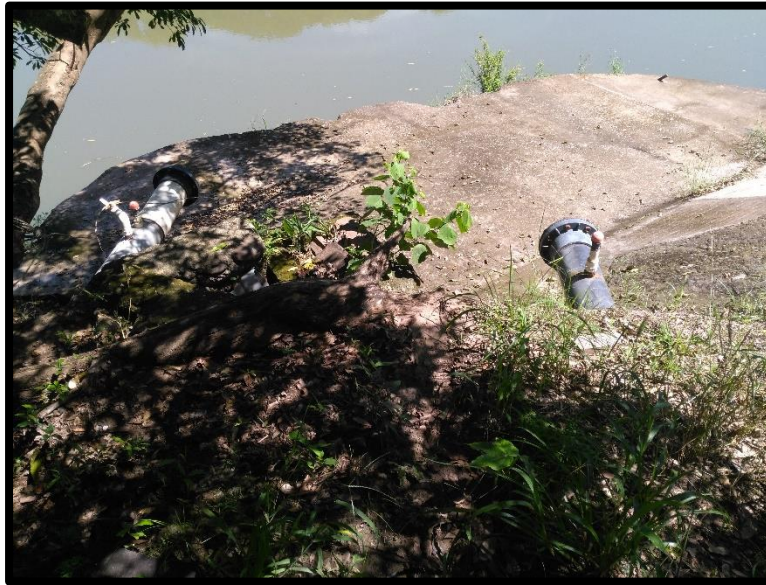
Figura 7. Séptima toma de agua encontrada en el sitio perteneciente al expediente administrativo número 4394 a nombre de Agropecuaria Federico Apestegui Sobrado S.A.

Según el Registro Nacional de Concesiones y Obras en Cauce de la Dirección de Agua; el expediente administrativo número 4394 a nombre de Agropecuaria Federico Apestegui Sobrado S.A. actualmente se encuentra en estado Cancelado . Es importante mencionar que no estaban bombeando agua del Río Tempisque al momento de la inspección. Sin embargo, se recomienda seguir con el seguimiento y control a dicha toma de agua para verificar que efectivamente no se esté dando ningún aprovechamiento de agua en dicho punto hasta el tanto no cuente con su respectivo permiso otorgado por esta Dirección.